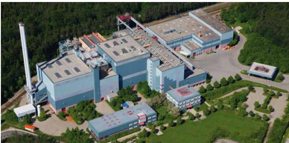
Das Werksgelände in Burgkirchen aus der Vogelperspektive

Unter einer kompetenten Führung wird es Einblicke in die Abläufe und die Kreisläufe der Abfallwirtschaft geben. Auch die Zusammenhänge bzgl. der Müllgebühren werden dabei verdeutlicht.